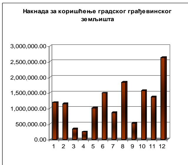
Табела 2 – Приходи који су се значајније остварили испод плана

Накнада за коришћење грађевинског земљишта, такође, бележи значајније остварење у 2013.години у односу на план. Наведени приход остварен је у износу од 14.182.164 динара, односно 28,9% у односу на план (2.03% свих прихода општине).