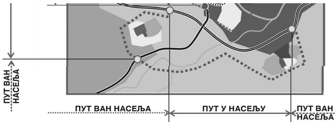
Слика 1-Карактеристичне деонице ванградског пута кроз насеље 1 Уличну мрежу у функционалном смислу у континуално урбанизованом подручју(грађевински реон) чиниће следеће категорије саобраћајница:

Градске магистрале(примарна саобраћајница) - саобраћајница која представља улазно - излазни правац у/из насеља. Њена функција је саобраћајно повезивање делова Општине на већим растојањима. Ове деонице имају доминантну градску функцију с тим што захтеви пролазних токова морају бити присутни у њеном обликовању