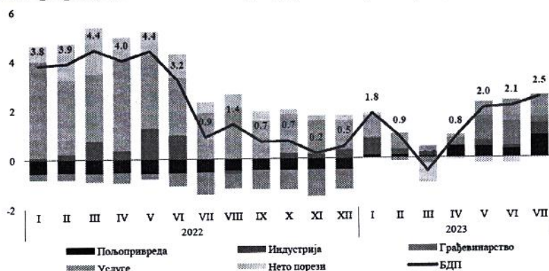
Индикатор привредне активности Србије, по секторима (доприноси расту, п.п.)

У првих седам месеци физички обим индустријске производње бележи раст од 1,9% м.г. и вођен је повећањем производње електро-енергетског сектора. Са стабилизацијом производње електричне енергије, али и под утицајем нешто ниже базе из истог периода претходне године, остварен је двоцифрени раст ове делатности који је у првих седам месеци износио 16,3% м.г. Истовремено, сектор рударства забележио је готово стагнативна кретања (пад од свега -0,5% м.г.), а мања експлоатација угља у овом периоду утицала је на изостанак бољих резултата овог сектора. Међутим, треба истаћи да је у јулу дошло до значајног опоравка у експлоатацији угља која је у овом месецу забележила смањење од 5,9% м.г., што је значајно боље него током другог квартала када је пад износио око 20%. У периоду јануар-јул прерађивачка индустрија је забележила благо смањење производње од 0,7%, пре свега као последица мање производње појединих извозно оријентисаних делатности услед нешто мање спољне тражње. Посматрано по областима прерађивачке индустрије, најзначајнији негативан допринос у првих седам месеци потиче од производње металних производа и нафтне индустрије које су забележиле смањење од 8,9% м.г. и 6,7% м.г., респективно. Истовремено и енергетски интензивне делатности попут производње основних метала и хемијске индустрије, које су значајно биле погођене негативним глобалним дешавањима, остварују смањење производње од 7,4% и 8,7% м.г. респективно. Међутим, и поред тога у овим областима је приметан