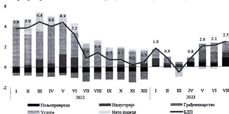
Индикатор привредне активности Србије, по секторима (доприноси расту, п.п.)

У првих седам месеци физички обим индустријске производње бележи раст од 1,9% м.г. и вођен је повећањем производње електро-енергетског сектора. Са стабилизацијом производње електричне енергије, али и под утицајем нешто ниже базе из истог периода претходне године, остварен је двоцифрени раст ове делатности који је у првих седам месеци износио 16,3% м.г. Истовремено, сектор рударства забележио је готово стагнативна кретања (пад од свега -0,5% м.г.), а мања експлоатација угља у овом периоду утицала је на изостанак бољих резултата овог сектора. Међутим, треба истаћи да је у јулу дошло до значајног опоравка у експлоатацији угља која је у овом месецу забележила смањење од 5,9% м.г., што је значајно боље него током другог квартала када је пад износио око 20%. У периоду јануар–јул прерађивачка индустрија је забележила благо смањење производње од 0,7%, пре свега као последица мање производње појединих извозно оријентисаних делатности услед нешто мање спољне тражње. Посматрано по областима прерађивачке индустрије, најзначајнији негативан допринос у првих седам месеци потиче од производње металних производа и нафтне индустрије које су забележиле смањење од 8,9% м.г. и 6,7% м.г., респективно. Истовремено и енергетски интензивне делатности попут производње основних метала и хемијске индустрије, које су значајно биле погођене негативним глобалним дешавањима, остварују смањење производње од 7,4% и 8,7% м.г. респективно. Међутим, и поред тога у овим областима је приметан