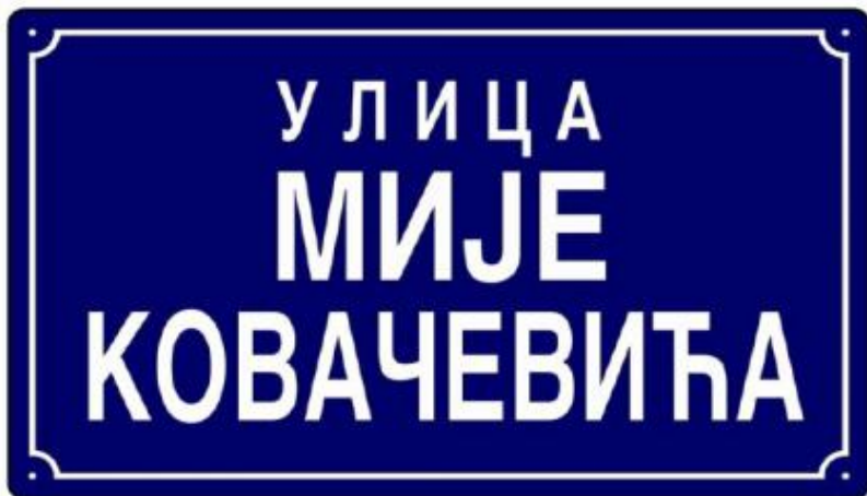
Истакнути називи су детаљно описани под 2.5, 2.6, 2.7 и 2.8

Напомена о табели Табела служи за идентификацију назива улица и тргова. Величина табеле Табела се поставља на висину од 1,80 до 2,00 метара изнад нивоа пута. Боја табеле Табела се поставља на плаву позадину са белом текстом и црним оквиром. Боја табеле је плава (RAL 5010) и боја текста је бела (RAL 9001). Материјал табеле Табела се израђује од алуминијума или другог материјала који одговара стандардима ЕУ. Напомена о шрифту Шрифт који се користи за израду табела је Cswiss Bold Широки и Y L Swiss Bold Широки. Шрифт који се користи за израду табела је Cswiss Bold Стандардни и Y L Swiss Bold Стандардни. Шрифт који се користи за израду табела је Cswiss Bold Сужени и Y L Swiss Bold Сужени. Позадина табеле Табела се поставља на плаву позадину са белом текстом и црним оквиром. Боја табеле је плава (RAL 5010) и боја текста је бела (RAL 9001).